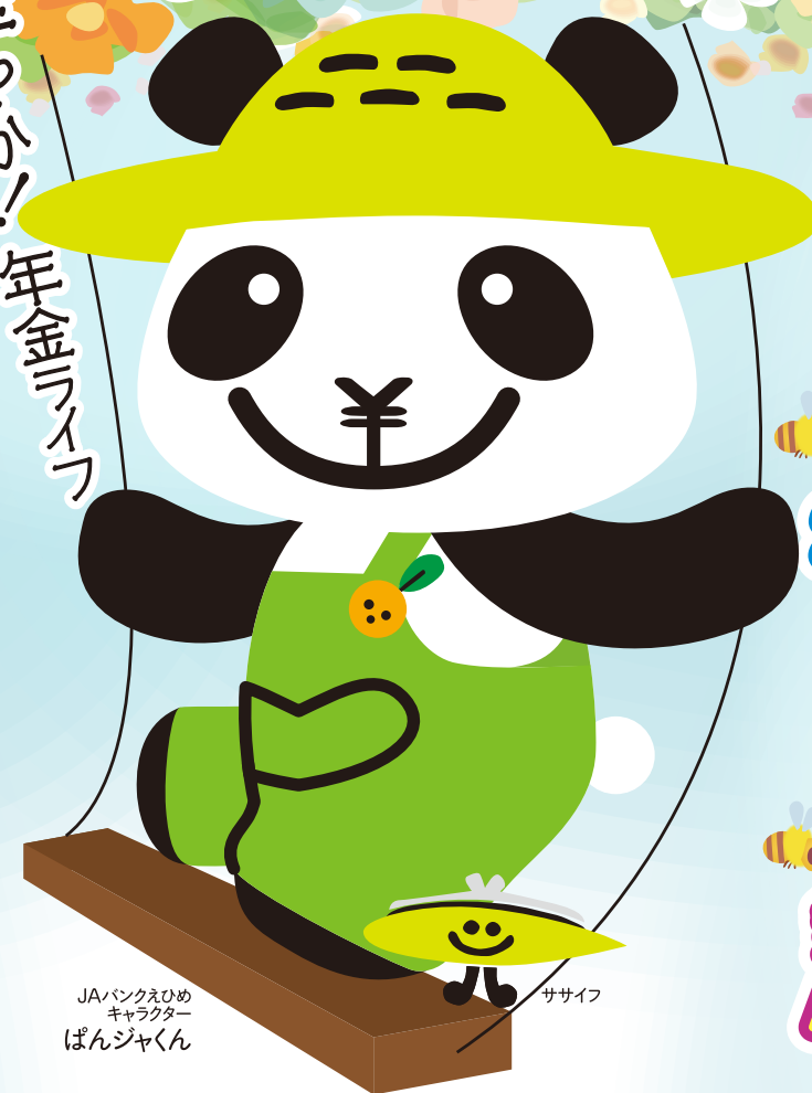
JAバンクえひめキャラクター ぱんじゃくん ササイフ